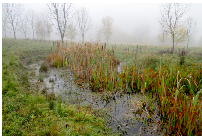
Obr. 2 Menší tůň v pokročilém stupni vývoje, České středohoří