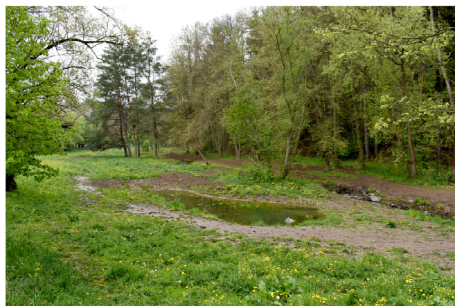
Obr. 1 Nově založenou tůň v Prokopském údolí v Praze aktivně využívá kriticky ohrožený skokan skřehotavý.

Drobné vodní plochy plní v krajině celou řadu vzájemně souvisejících funkcí (Tabulka 2, Obr. 3). Míra plnění těchto funkcí závisí na typu ploch. Ten má především vliv na hloubku vody (vyšší u rybníků), proudění vody (v podstatě jen u přehrádek na bystřinách), kolísání hladiny vody (méně u rybníků, více u dalších typů), ostrost hranice a její konstrukční řešení (umělé u přehrádek, částečně umělé u rybníků, přirozené u mokřadů a tůň), ale též na intenzitě lidských zásahů (intenzivní produkce u některých rybníků, spontánní vývoj u některých mokřadů a tůň apod.).