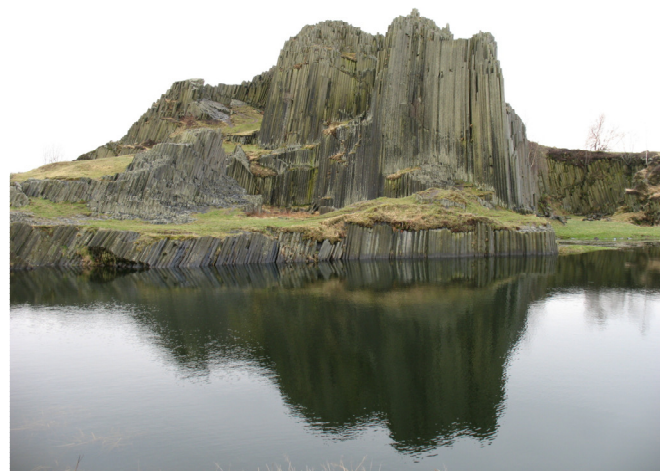
Obr. 3 Jezírko pod Panskou skálou u Kamenického Šenova podtrhuje dominantu skalního výchozu a je vynikající ukázkou estetické funkce drobných vodních ploch.